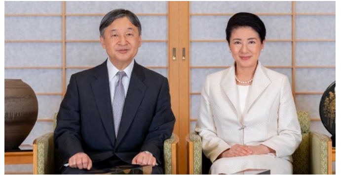
Japon İmparatoru Naruhito ve Eşi, İngiltere Ziyaretine Başladı

nükleer güce sahip ABD uçak gemisi Theodore Roosevelt'in, Japonya ile ortak askeri tatbikat yapmak üzere cumartesi günü Güney Kore'nin liman kenti Busan'a ulaştığı belirtildi. ABD, Güney Kore ve Japonya'nın liderleri, Ağustos 2023'te Camp David zirvesinde, Çin'in Güney Çin Denizi'ndeki tartışmalı su yolundaki "tehlikeli ve saldırgan davranışlarını" kınarken yıllık askeri eğitim tatbikatları yapma konusunda anlaşmışlardı. Rusya Devlet Başkanı Vladimir Putin, 24 yıl sonra ilk kez bu hafta Kuzey Kore'yi ziyaret etti ve lider Kim Jong Un ile karşılıklı savunma taahhüdünü içeren bir anlaşma imzaladı. Bu, Rusya'nın Asya'da yıllardır gerçekleştirdiği en önemli hamlelerden biriydi ve Kim Jong Un bunu bir ittifak olarak nitelendirdi. Bu ziyaret, Kuzey Kore'nin nükleer ve füze programlarına karşı genişletilmiş bir caydırıcılık gösterisi olarak bir başka ABD uçak gemisi Carl Vinson'un Güney Kore'ye yaptığı ziyaretin yedi ay sonrasına denk geldi. Güney Kore donanması, ABD'nin nükleer güce sahip uçak gemisi Theodore Roosevelt'in ortak askeri tatbikat için Güney Kore'nin liman kenti Busan'a ulaştığını bildirerek, bölgedeki güvenlik işbirliğinin önemine vurgu yaptı.