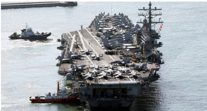
ABD Uçak Gemisi Askeri Tatbikat İçin Güney Kore'de

giysi” olarak niteleyen bu yasaya göre artık Müslüman kadınlar başörtüsü takamayacak. Ayrıca İslam dininin bayramları olan Ramazan ve Kurban bayramları da Tacikistan da kutlanmayacak. Daha öncesinde okullarda ve kamu kurumlarında başörtüsünü yasaklayan düzenleme, 19 Haziran 2024 tarihinde parlamentodan geçti. Yasama organı tarafından kabul edilen düzenlemeyi, Tacikistan Cumhurbaşkanı İmamali Rahman 24 saat geçmeden imzaladı. Düzenleme 20 Haziran itibariyle yürürlüğe girdi. Söz konusu kanun ile başörtüsünün giyilmesi, satılması, ithal edilmesi ve reklamının yapılması tamamen yasaklandı. Uzun yıllardır Tacikistan’da başörtüsü yasağı gayriresmi bir şekilde uygulanmaktaydı. Bu yasa ile başörtüsü yasağı resmileşmiş oldu. Kanun değişikliğinin amacı “milli kültürel değerlerin korunması, batıl inanç ve aşırıcılığın önlenmesi, merasim ve bayramlarda israfa yer verilmemesi” olarak açıklandı. Tacikistan’ı 1992 yılından beri yöneten İmamali Rahman 2017 yılında yaptığı bir konuşmada “Kadınların kullandığı başörtüsü ve siyah giysilerin Tacik geleneklerine uygun olmadığını ve başörtüsünün dinle ilişkisinin bulunmadığını” belirtmişti. Yasanın ihlal edilmesi durumunda ise para cezaları uygulanacak. Yasayı ihlal eden Tacikistan vatandaşları 7 bin 920 Tacikistan somonisi (Yaklaşık 25 bin Türk lirası), hükümet yetkilileri 54 bin somoni (Yaklaşık 167 bin Türk lirası) ve dini otoriteler 57 bin 600 somoni (Yaklaşık 178 bin Türk lirası) gibi para cezalarına çarptırılacak.