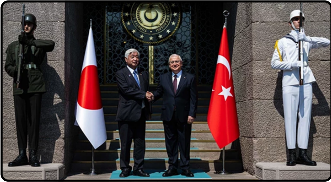
Türk SİHA'larına Japonya'dan Ziyaret

savunma ilişkisi geliştirmenin hem NATO çerçevesinde hem de Avrupa Birliği güvenlik vizyonu açısından işlevsel bir tercih olduğunu göstermektedir. Ayrıca Macron'un Türkiye'nin "Gönüllüler Koalisyonu" kapsamındaki katkılarına öne çıkarması, Ankara'nın uluslararası inisiyatiflerde giderek daha merkezi bir aktör haline geldiğini teyit etmektedir. Bütün bu unsurlar birlikte değerlendirildiğinde, Erdoğan-Macron telefon görüşmesi, yalnızca ikili ilişkilerin güncel bir yansıması değil, aynı zamanda Türkiye-Fransa ilişkilerinin yeniden çok boyutlu bir ortaklık eksenine oturma potansiyelinin işareti olarak okunmalıdır. Bu görüşme, tarafların hem Avrupa güvenliği hem Orta Doğu krizleri hem de savunma iş birliği çerçevesinde birbirini tamamlayan konular geliştirme arayışında olduklarını göstermekte ve bu yönüyle uluslararası siyasette çok aktörlü diplomasiyi işlevselliğini kanıtlayan bir örnek teşkil etmektedir.