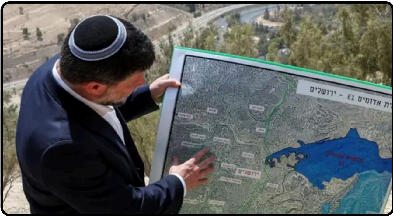
E1 Projesi ve Gazze Planı

İngiliz halkının temel değerlerine meydan okumaktadır” biçiminde bir değerlendirmede bulunmuştur. Diğer yandan, 800’den fazla hukukçu, akademisyen ve eski yargıç, Başbakan Starmer’e İsrail’e yönelik yaptırımlar uygulanması çağrısında bulunmuşlardır. Bu talep, mevcut uluslararası hukuk normlarının ihlal edildiği algısını güçlendirmiştir. İngiltere Parlamentosu’ndan yaklaşık 40 milletvekili, ülkenin İsrail saldırılarına katkısını mercek altına almak amacıyla bağımsız bir soruşturma talep etmiştir. Özellikle İngiltere’nin istihbarat paylaşımı ve Kraliyet Hava Kuvvetleri üslerinin rolü olarak değerlendirilen konularla ilişkilendirilmiştir. Burada göze çarpan husus, İngiltere’nin eski pasif pozisyonunu terk ederek, hem etik hem hukuki sorumluluğu harekete geçiren bir dış politika tutumu benimsemesidir. Bu yaklaşım, Birleşik Krallık’ın uluslararası normlara bağlılığını pekiştirme niyetinde olduğunu göstermektedir.