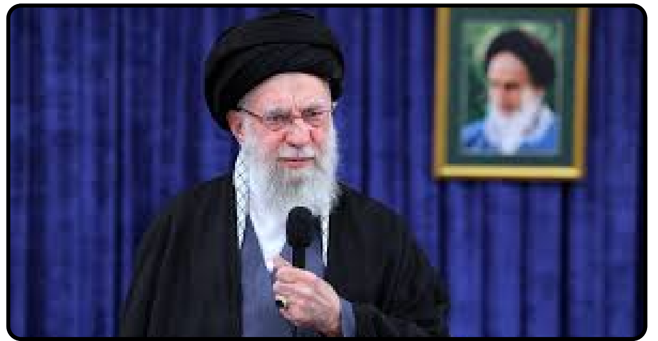
İran'da Hamaney'den Af Kararı

sağlamlaştırıyor. Akademik analizlerin ortaklaştığı nokta şu: Eğer AB, Batı Balkanlar'ı kendi bünyesine entegre edecek somut bir takvim sunamazsa, bölgedeki güç boşluğu Rusya ve Çin gibi revizyonist aktörler tarafından hızla doldurulacaktır. 2026 yılı, Balkanlar için ya Avrupa rüyasının yeniden canlandığı ya da etnik milliyetçiliğin domino etkisi yaratarak bölgeyi tekrar 90'lı yılların karanlığına sürüklediği bir kırılma yılı olacak. Bizlerin bu süreçte takip etmesigereken asıl soru; ekonomik teşviklerin, kökleşmiş tarihsel husumetleri yenip yenemeyeceğidir. 2026 ortasında planlanan Balkan Zirvesi, bu sorunun cevabını verecek olan en önemli durak niteliğindedir. Sonuç olarak, Balkanlar'ın geleceği sadece sınırların değil, aynı zamanda siyasal iradenin ve diplomatik vizyonun da sınavıdır. Bölgedeki bu tıkanıklık, Avrupa'nın kendi içindeki normatif güç dönüşümünü de derinden etkileyecektir. Özellikle genç nüfusun bölgeden göç etme eğilimi, siyasi istikrarsızlığın yarattığı umutsuzluğun en somut göstergesi olarak analizlerimizde yer almalıdır.