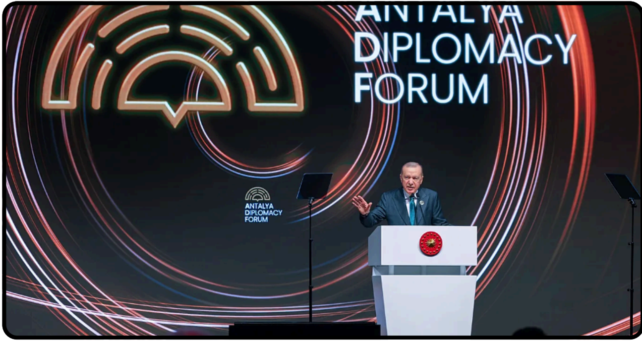
Antalya Diplomasi Forumu ve Türkiye'nin “Orta Güç” Stratejisi

Asıl soru burada ortaya çıkıyor: Türkiye'nin bu erken pozisyon alma hamlesi İsrail'in söylemini gerçekten sınırlandırabilir mi yoksa bu sadece daha uzun ve kontrollü bir rekabetin başlangıcı mı?