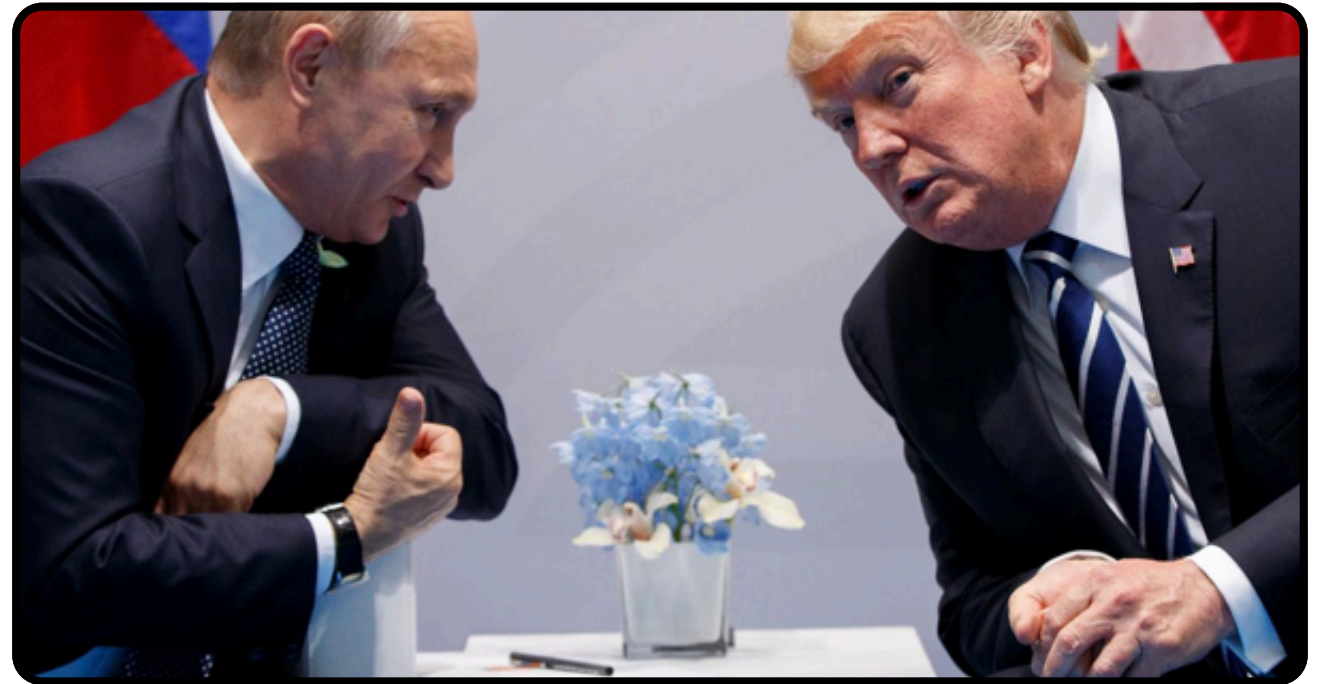
Putin'in Miami Hamlesi: Sembolik mi, Stratejik mi?

Körfez'in yaşadığı ikilem, klasik güvenlik tartışmalarının ötesine geçmiş durumda. Soruntehditleri dengelemekten çıkıp ekonomik akışın sürdürülebilirliğini güvence altına alacak bir denge kurabilmeye dönüştü. Hürmüz, Körfez'in stratejik tercihlerini yeniden düşünmek zorunda kaldığı bir eşik haline gelmiş durumda.