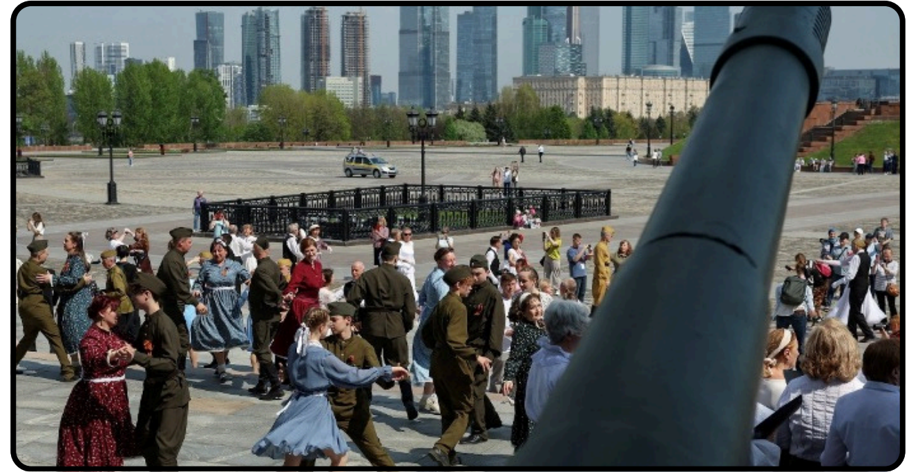
Savaşın Ortasında Kırılgan Bir Ateşkes: Rusya ve Ukrayna Arasındaki Diplomasi

önüne alındığında, Lübnan'daki gerginliğin artması Orta Doğu'da daha geniş bir güvenlik krizi doğurabilir. Analistler, İsrail ile Hizbullah arasında çıkabilecek tam ölçekli bir savaşın yalnızca bu iki tarafı değil, Suriye, İran ve Körfez ülkelerini de etkileyeceğini vurguluyor. Diğer yandan, Lübnan ekonomisinin uzun süredir ciddi bir kriz içerisinde olması, ülkedeki güvenlik sorunlarını daha da zor bir hale getiriyor. Ekonomik çöküş, yüksek enflasyon ve siyasi belirsizlikle başa çıkan Lübnan'da yeni bir çatışma olasılığı, halk üzerindeki gerginliği artırıyor. Beyrut'taki siviller, geçmişteki savaşların yeniden yaşanma korkusunu dile getirirken, hükümet uluslararası topluma daha güçlü bir diplomatik müdahaleye dair çağrıda bulundu. Uzmanlara göre mevcut gelişmeler, bölgedeki ateşkes anlaşmalarının ne kadar kırılgan olduğunu bir kez daha gözler önüne seriyor. Taraflar arasında kalıcı bir siyasi çözüm sağlanmadıkça benzer eylemlerin sürmesi ve bölgesel gerginliğin yeniden artması oldukça olası görünüyor.