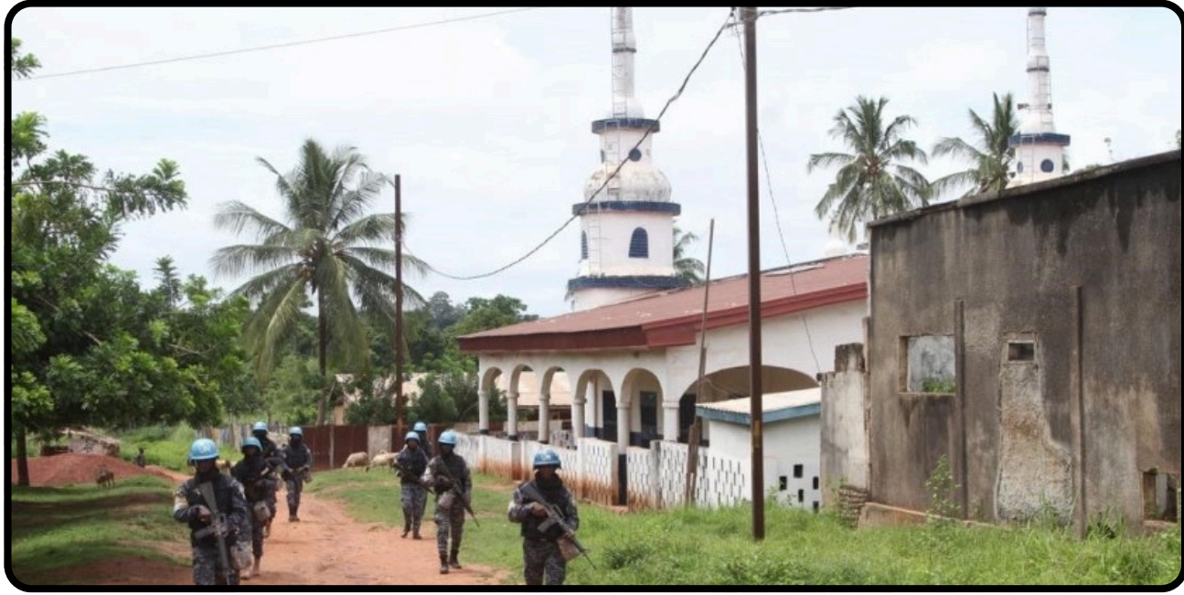
ABD'nin Mültecilere Yönelik Göç Politikası ve Orta Afrika Cumhuriyeti Kararı

sorunları yaratma riskini de artırmaktadır. Buna karşılık Kuzey Kore, son yıllarda elde ettiği diplomatik manevra alanını genişletmiş durumda. Rusya ile yakınlaşması ve Ukrayna savaşı bağlamında Rusya'ya dolaylı destek vermesi, Pyongyang'ın artık yalnızca Çin'e bağımlı bir aktör olmadığını gösteriyor. Bu durum, Kim Jong Un'un pazarlık gücünü artırırken Çin'in baskı kapasitesini sınırlandırıyor. Ziyaretin sembolik yönü de oldukça güçlü. Ortak törenler, dostluk vurguları ve "tarihi dönem" söylemi, iki ülkenin ilişkilerini yeniden tanımlama çabasına işaret ediyor. Ancak somut ekonomik veya askeri anlaşmaların açıklanmamış olması, bu yakınlaşmanın henüz stratejik çerçevede kaldığını gösteriyor. Sonuç olarak bu ziyaret, yeni bir ittifak doğurmaktan ziyade mevcut güç dengelerinin yeniden müzakere edildiği bir stratejik hatırlatma niteliği taşıyor. Çin, Kuzey Kore'yi tamamen kaybetmediğini göstermek isterken Pyongyang ise çok kutuplu sistemde daha bağımsız bir aktör olduğunu kanıtlamaya çalışıyor.