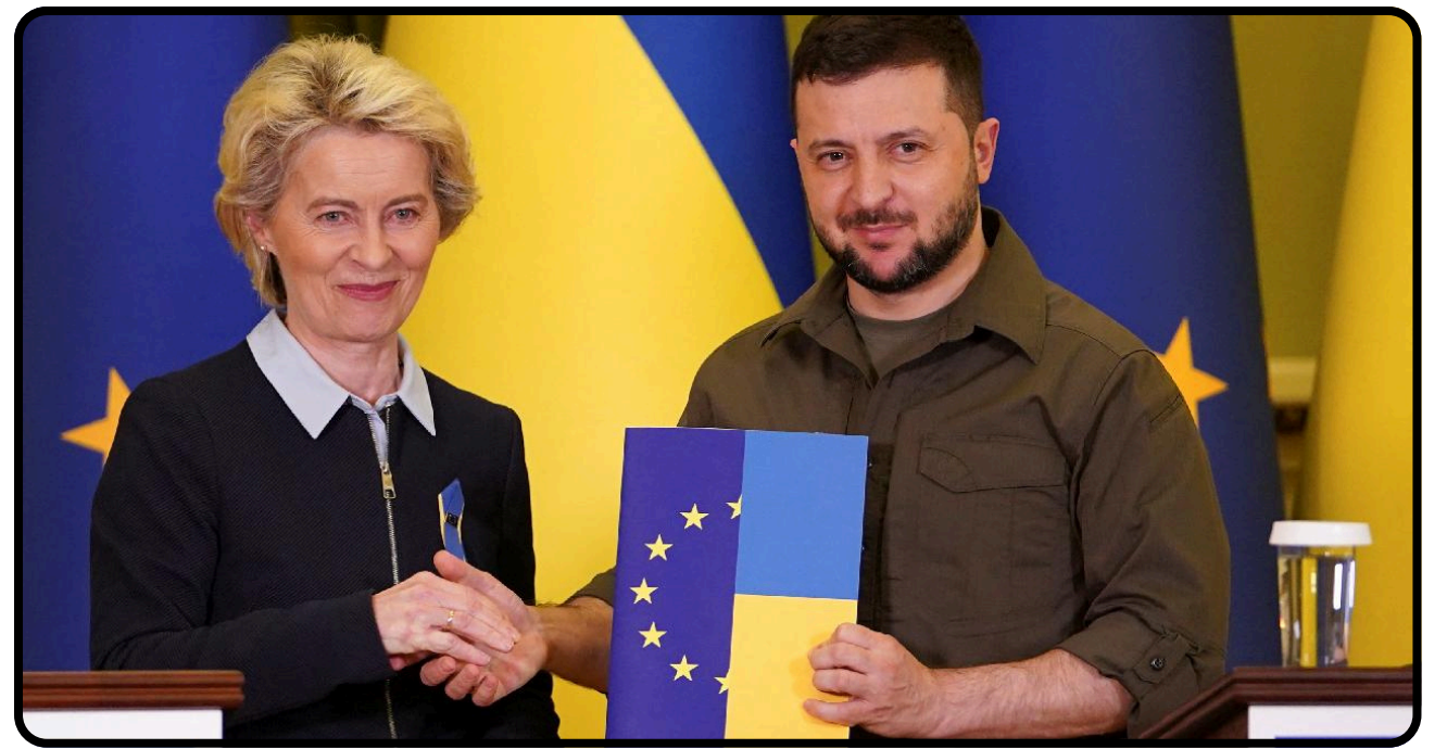
Ukrayna'nın AB Üyelik Müzakerelerinin Güncel Durumu: Stratejik ve Politik Bir Dönüşüm

dır. Uydu görüntülerinde dikkat çeken bir diğer husus, Tebriz gibi balistik füze üslerindeki tünel girişlerinde başlayan hızlı enkaz kaldırma ve yeraltı tahkimat çalışmalarıdır. Bu durum İran'ın "stratejik derinlik" ve yeraltı savunma sanayii tesislerini (füze şehirleri) koruma önceliğini yansıtmaktadır. Ancak ülkenin içinde bulunduğu kronik ekonomik kriz ve iç güvenlik zafiyetleri (Basij karargahlarına yönelik saldırılar ve toplumsal hareketler), bu savunma altyapısının orta ve uzun vadede tamamen yeniden inşa edilmesine (reconstruction) sınırlandıracak en büyük yapısal handikaplardır. Sonuç olarak, modern hava gücü ve hassas güdümlü mühimmatlar bir devletin konvansiyonel askeri kapasitesini kısa sürede felç edebilmektedir. Ancak asimetrik harp unsurlarına, yeraltı lojistik ağlarına ve köklü bir savunma sanayii doktrinine sahip devletlerin, yapısal hasara rağmen bölgesel bir "tehdit odağı" ve asimetrik güç çarpanı olarak kalmaya devam edebileceği görülmektedir.